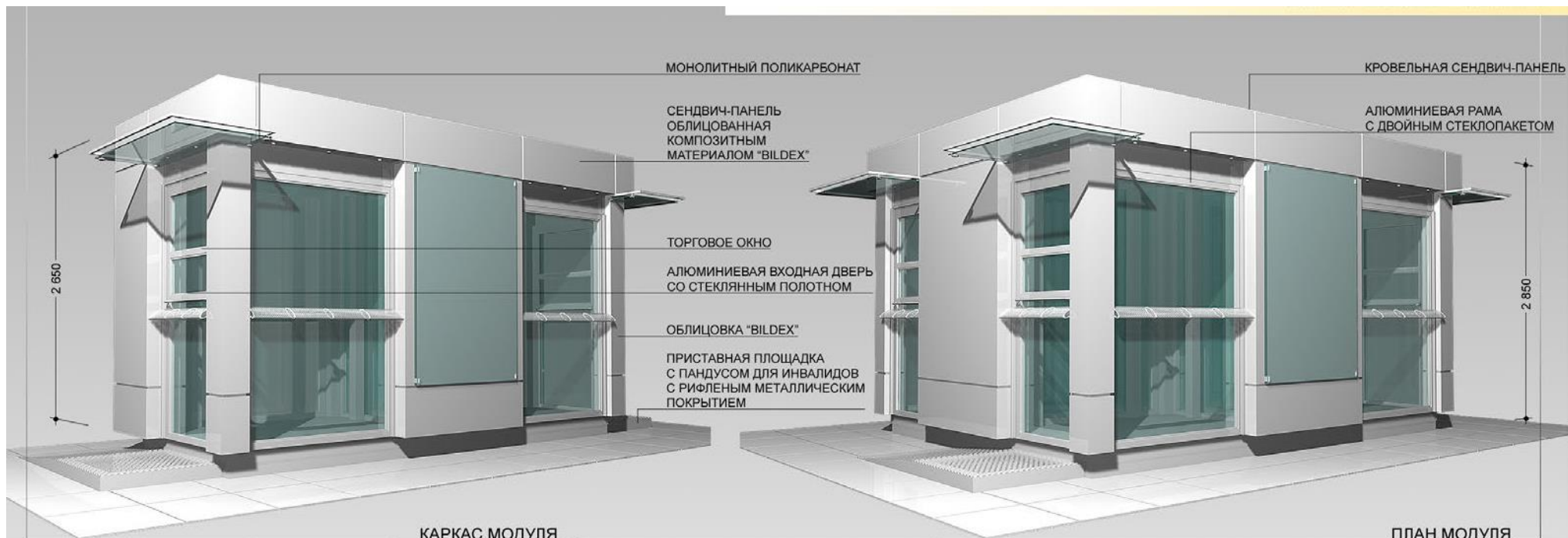
КАРКАС МОДУЛЯ (СВАРНОЙ, СБОРНЫЙ)