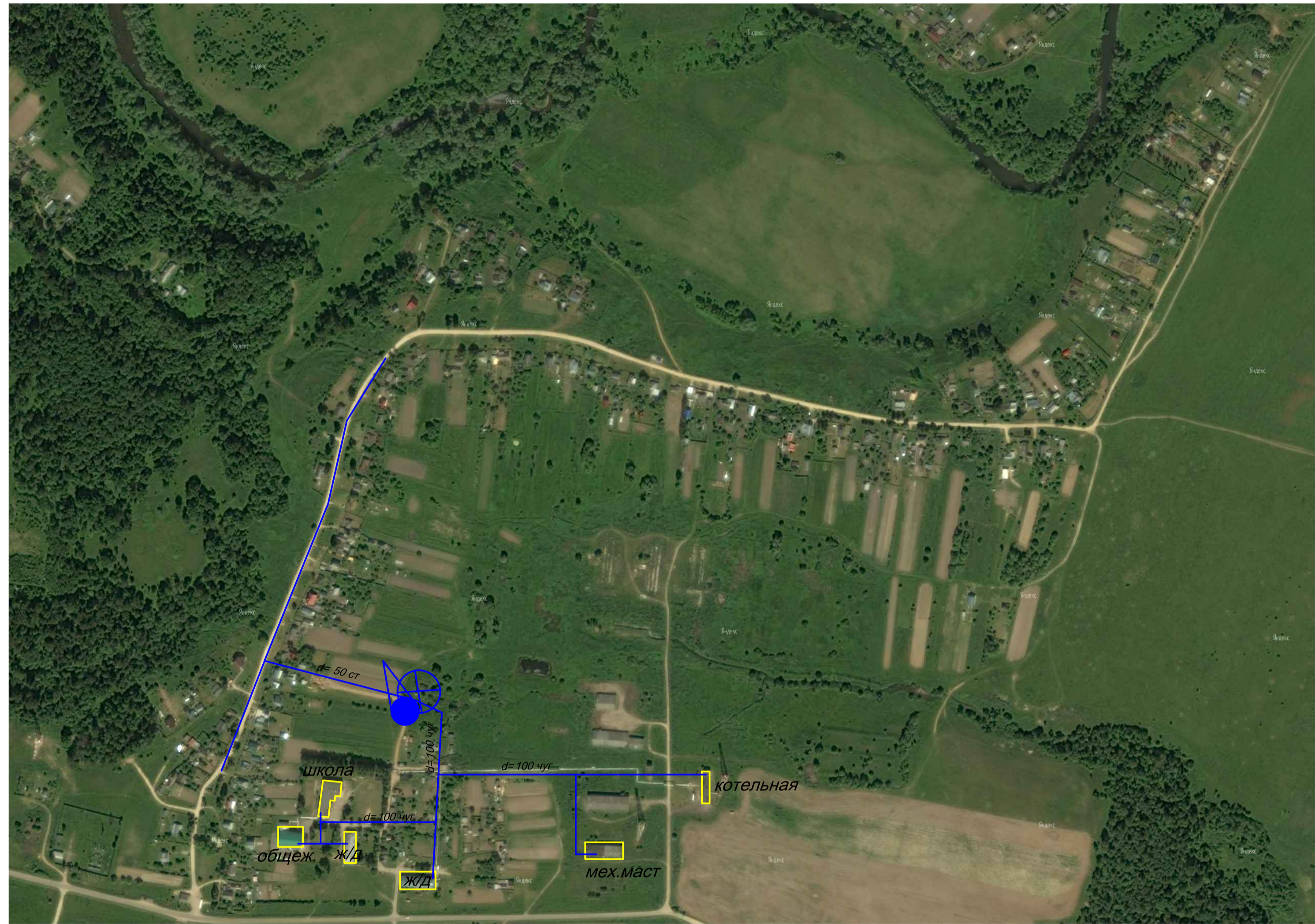
СХЕМА ВОДОСНАБЖЕНИЯ д. ВЫШГОРОД