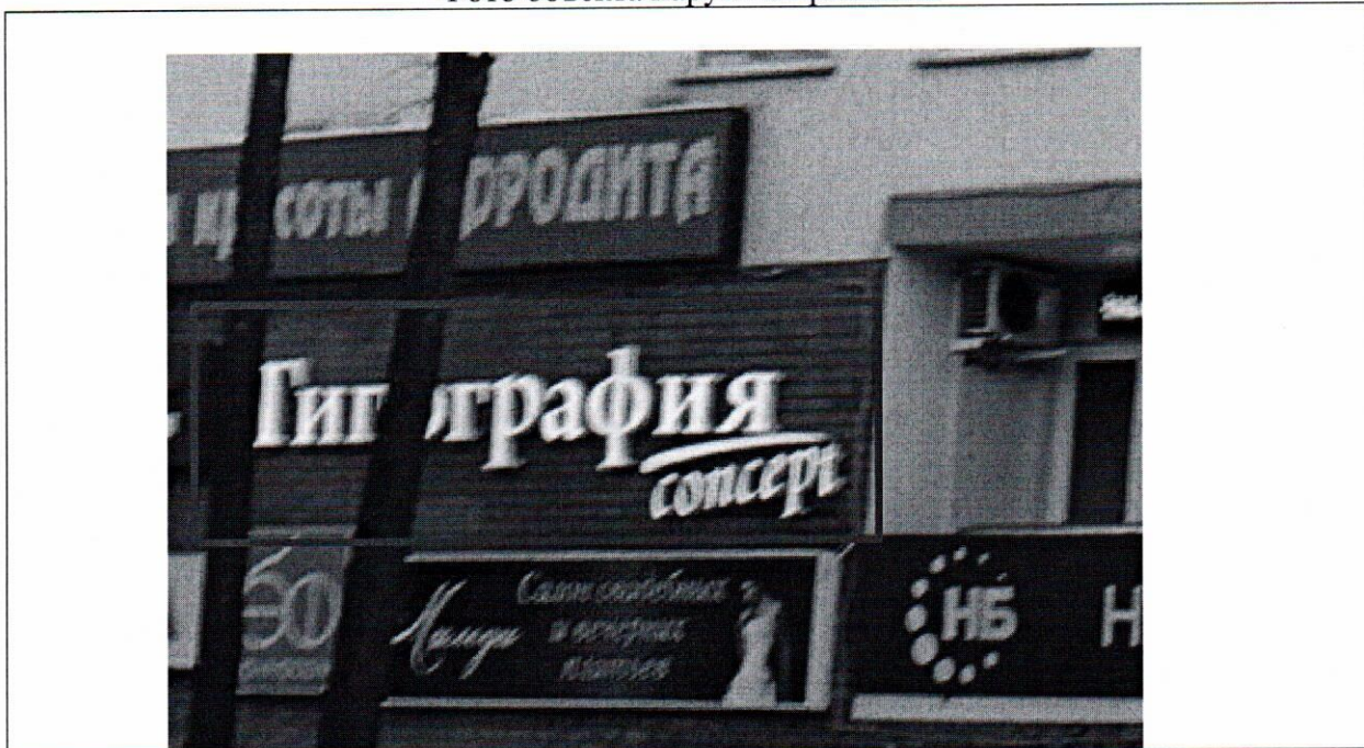
Фото объекта наружной рекламы

21 февраля 2018 года проведена визуальная проверка объекта наружной рекламы по адресу: Московская область, Наро-Фоминский городской округ, г. Наро-Фоминск, Площадь Свободы, д. 1Б.