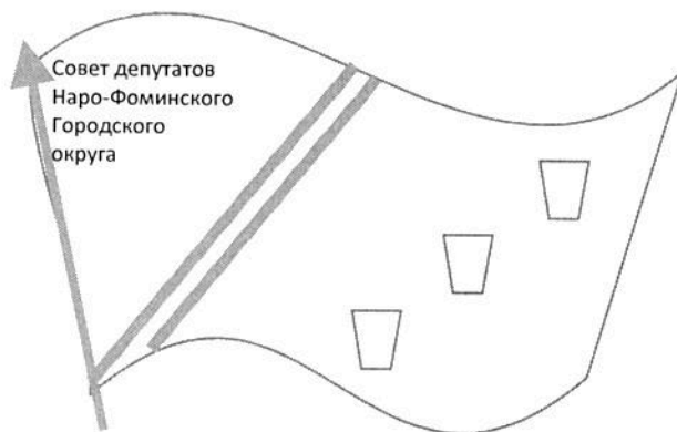
Рисунок нагрудного знака: