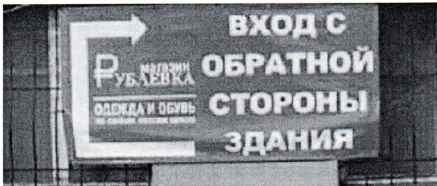
Фото средства размещения информации

«15» августа 2018 года проведена визуальная проверка средства размещения информации по адресу: Московская область, г. Наро-Фоминск, пл. Свободы, д.7.