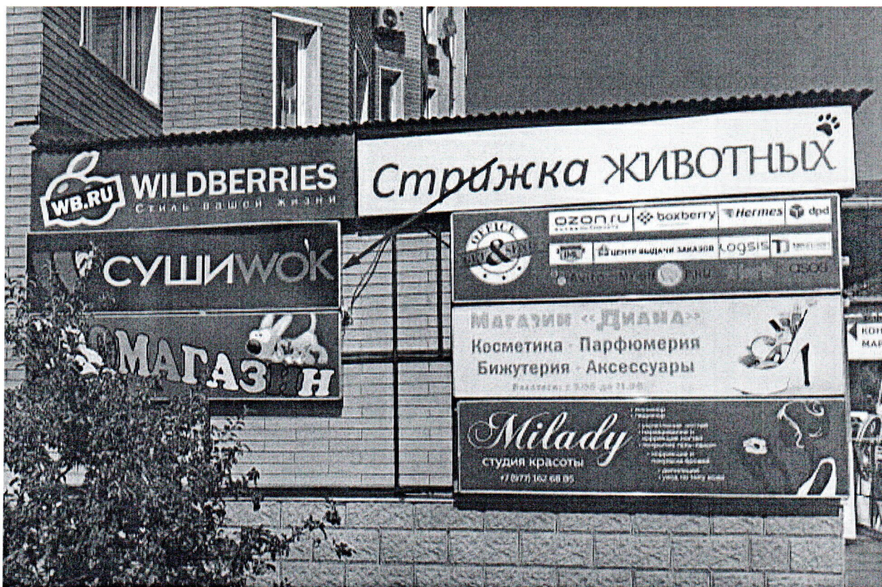
Фото средства размещения информации

«03» августа 2018 года проведена визуальная проверка средства размещения информации по адресу: Московская область, Наро-Фоминский г.о., г. Апрелевка, ул. Островского, д. 38.