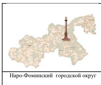
Рисунок нагрудного знака «Наро-Фоминский городской округ»:

Плакетка и удостоверение упаковывается во флокированную коробку изумрудного цвета с откидной крышкой. Коробка застёгивается на вшитые магниты.