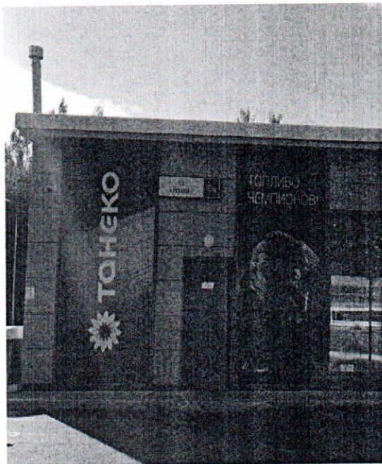
Фото объекта наружной рекламы