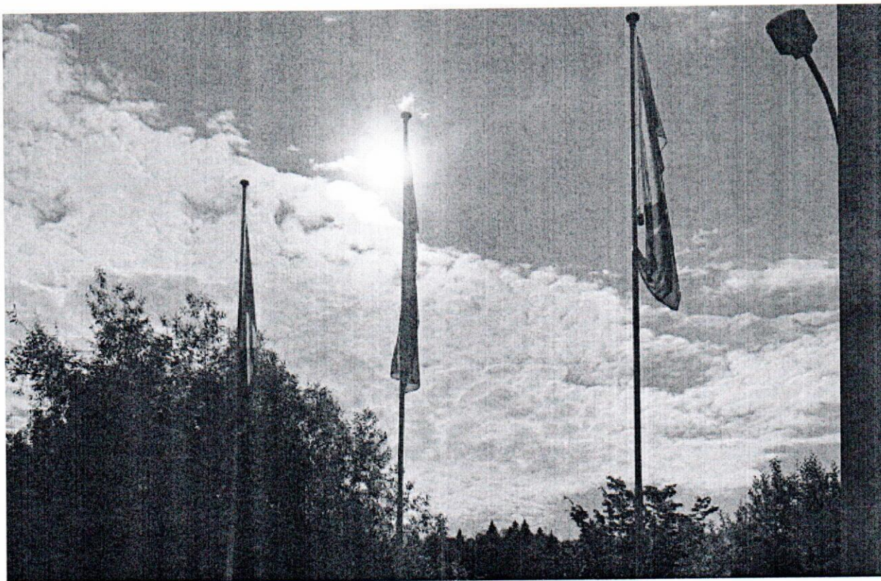
Фото объекта наружной рекламы

21 июня 2019 года проведена визуальная проверка объекта наружной рекламы по адресу: Московская область, Наро-Фоминский район, АЗС 52-й км автодороги "Украина"