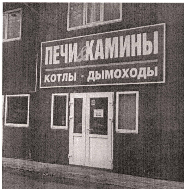
Фото средства размещения информации

«08» июля 2019 года проведена визуальная проверка средства размещения информации по адресу: Московская область, Киевское шоссе, 74 км, строительный рынок «Ковчег». Владелец средства размещения информации (организационно-правовая форма организации, ФИО, должность руководителя, почтовый адрес, телефон): Не установлен. Законный владелец недвижимого имущества, к которому присоединено средство размещения информации и (или) средства размещения информации (организационно-правовая форма организации, ФИО, должность руководителя, почтовый адрес, телефон): Не установлен.