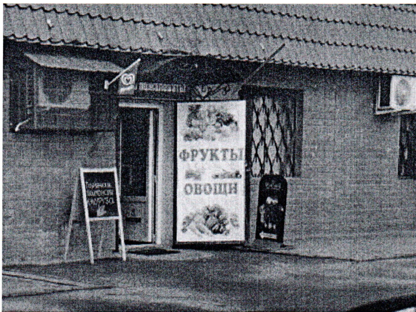
Фото средства размещения информации

«06» августа 2019 года проведена визуальная проверка средства размещения информации по адресу: Московская область, Наро-Фоминский г.о., д. Таширово.