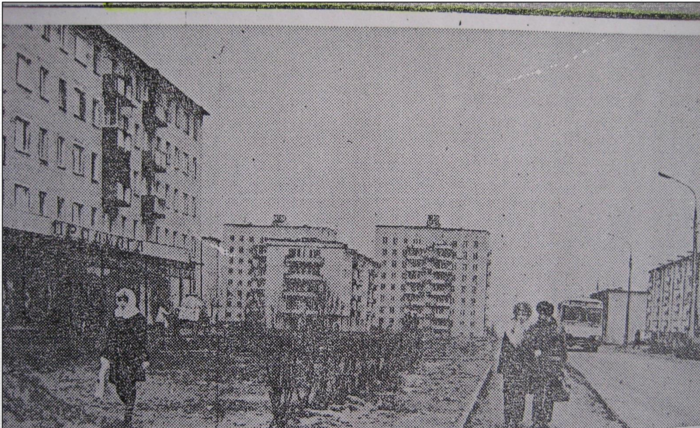
улица Латышская. 1976 год