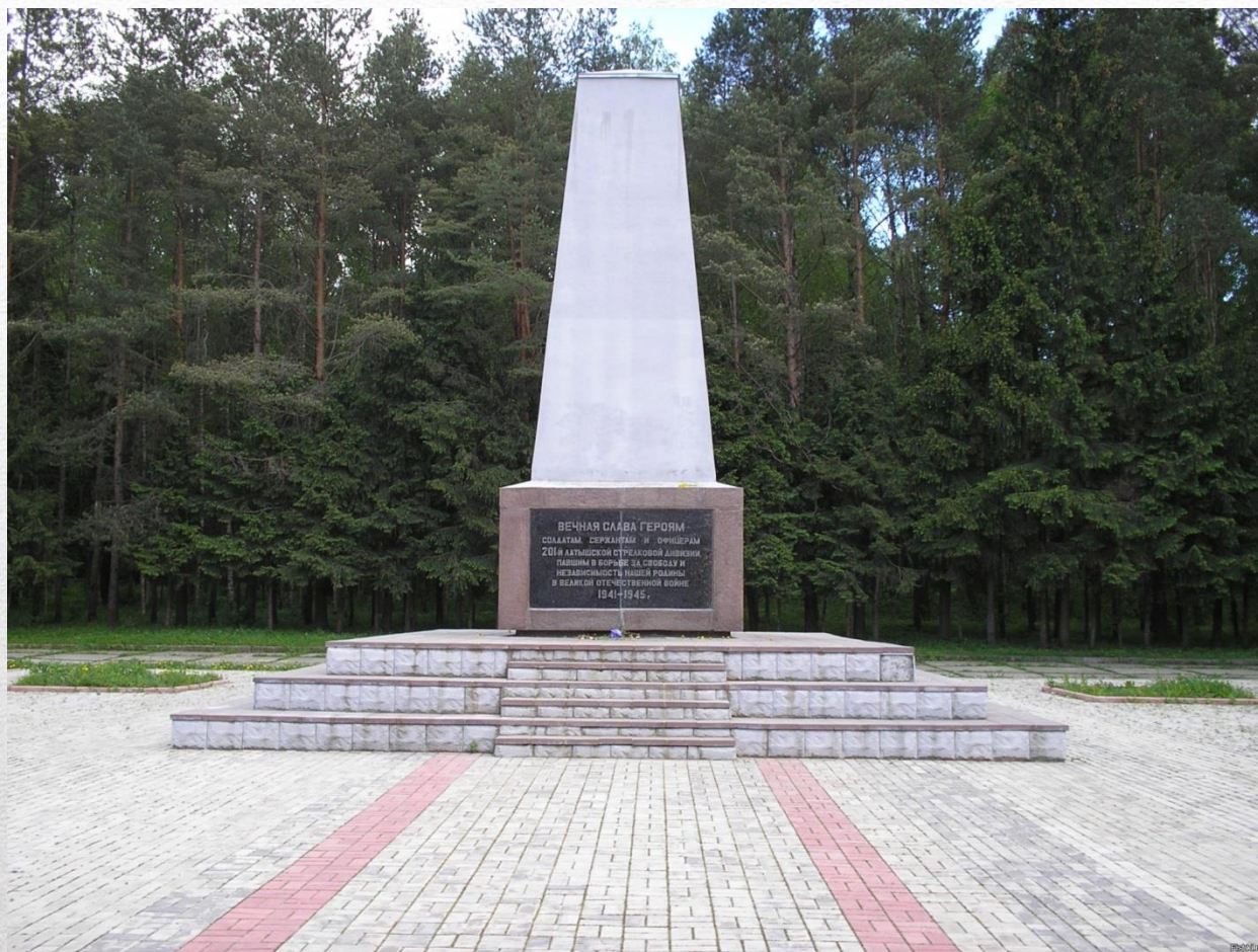
Памятник воинам 201 Латышской стрелковой дивизии, освобождавшим г. Наро-Фоминск от немецко- фашистских захватчиков ( после реставрации)