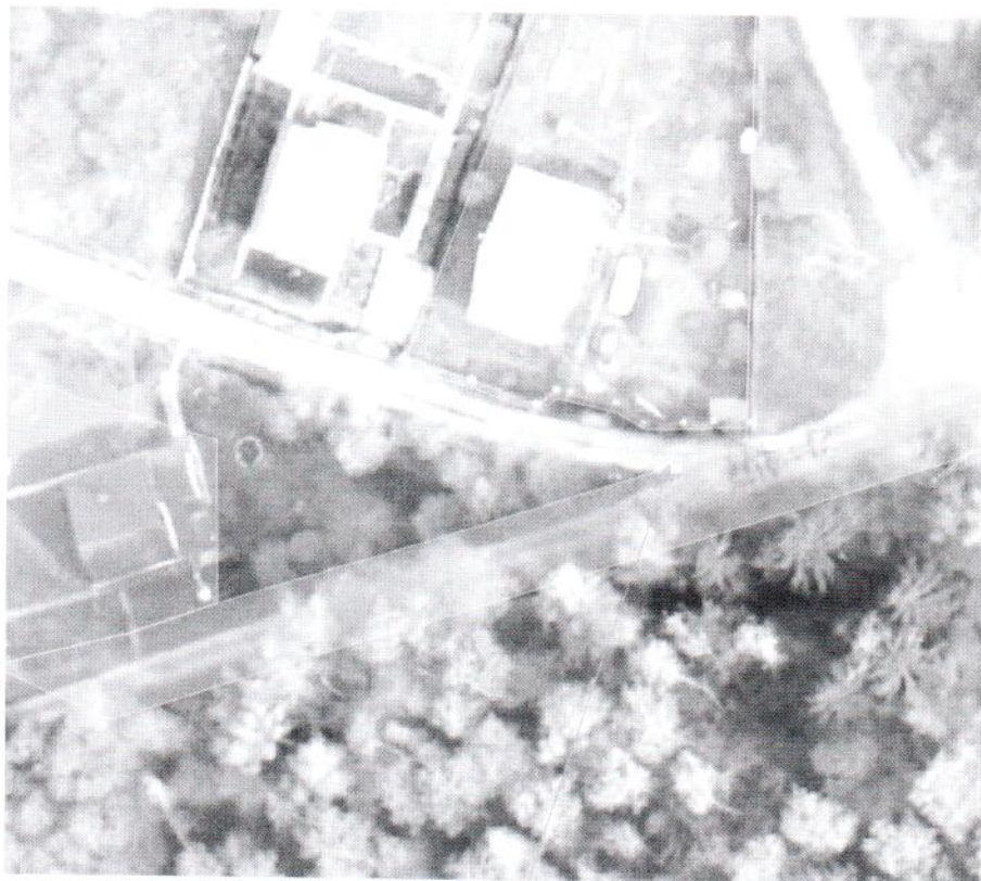
Местоположение автоматических ворот