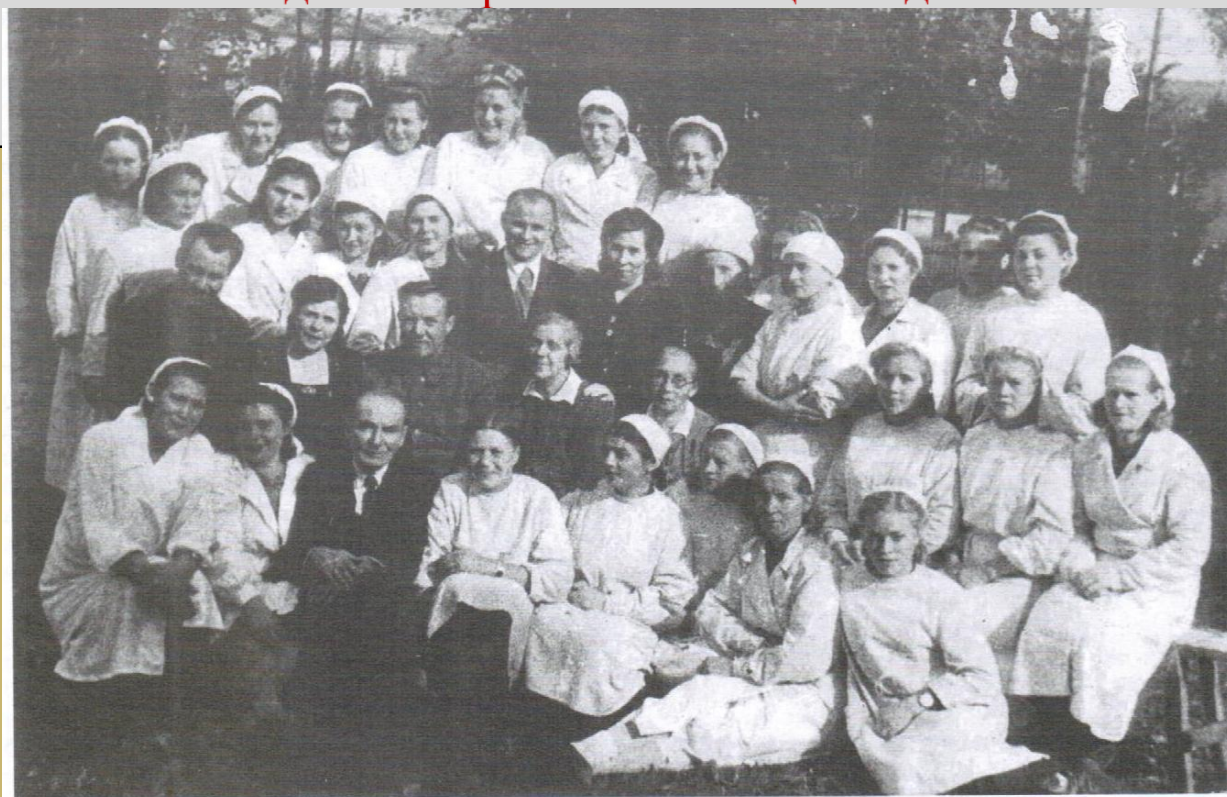
Персонал Наро-Фоминской районной больницы. 1942-1943 годы