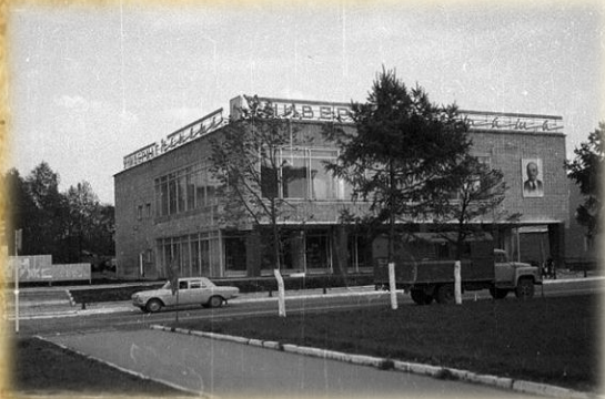
Наро-Фоминский архив. Фонд 82. Опись 1. Дело 673. Л. 86