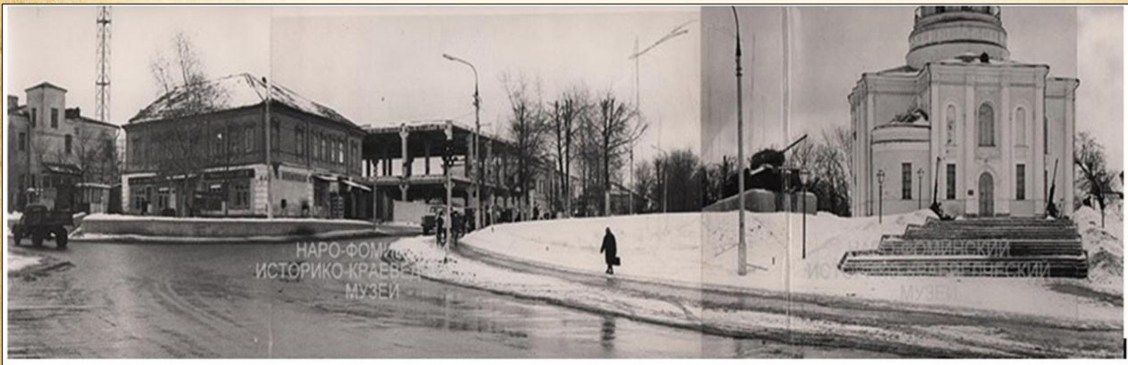
70-е годы прошлого века.