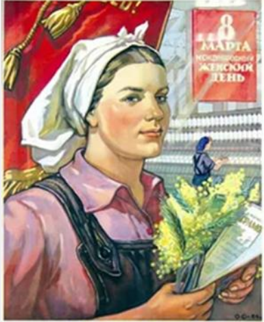
Слава советской женщине!

Слава советской женщине! Это слава советской женщине. Это слава советской женщине. Это слава советской женщине.