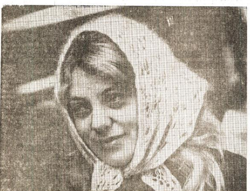
Она была на производстве...