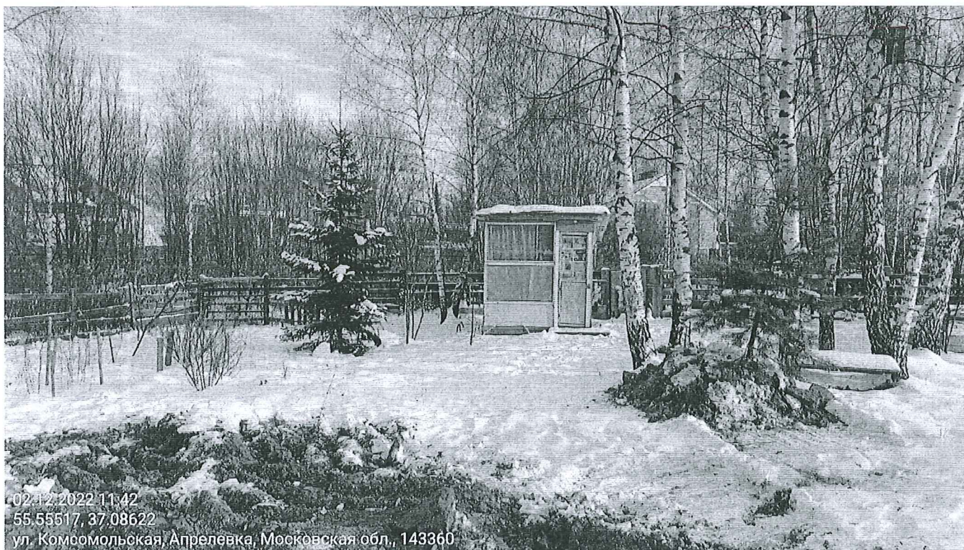
02.12.2022 11:42 55.55517, 37.08622 ул. Комсомольская, Апрелька, Московская обл., 143360