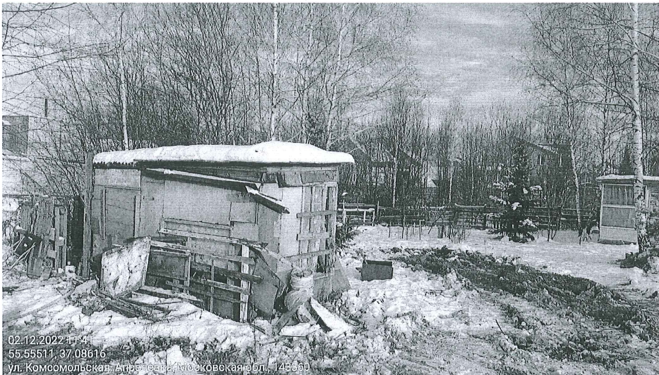
02.12.2022 11:41 55.55511, 37.08616 ул. Комсомольская, Апрелька, Московская обл., 143360