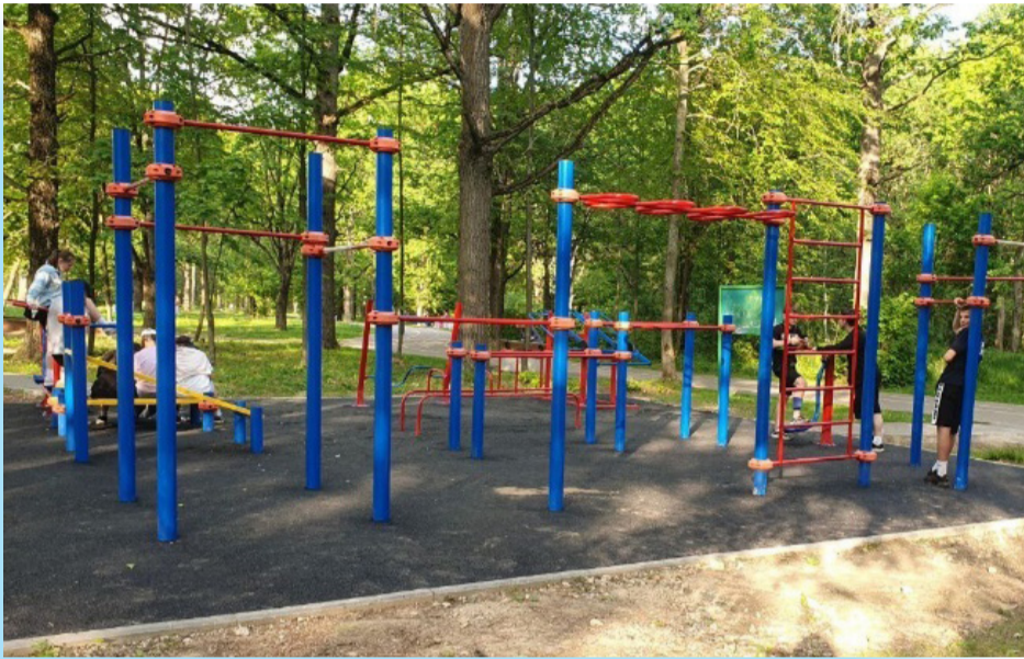
Воркаут-площадка в Калининце

Лесопарк вошел в план по благоустройству на 2023–2024 годы по программе «Парки в лесу», которая подразумевает санитарную очистку территории, обустройство прогулочных дорожек, зон для различных активностей и отдыха, установку освещения, лавочек, урн. Также будет обустроена входная группа, включающая парковку.