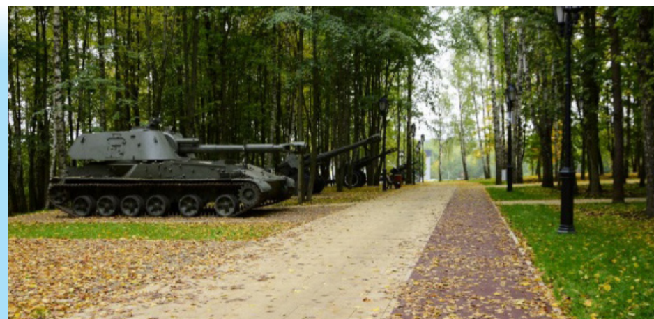
Благоустройство парка «Патриот» в Наро-Фоминске

нейшего благоустройства набережной. По проекту в течение 2023–2025 годов планируется продлить набережную до стадиона «Трудовые резервы», обустроить освещение, установить малые архитектурные формы, детские и спортивные площадки.