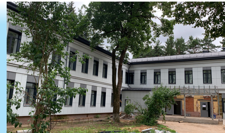
Капитальный ремонт взрослой поликлиники в с. Петровское

Весной прошлого года начался ремонт взрослой поликлиники в с. Петровское, который мы контролируем и сопровождаем, завершиться он должен осенью 2023 года. За это время выполнен большой объем по демонтажу, а также завершен ремонт кровли и фасада, заменены оконные блоки. Продолжается прокладка коммуникаций и работы по внутренней отделке здания. Несмотря на то, что здание построено в конце XIX века, после завершения ремонта оно будет выглядеть современно, стильно, а самое главное будет комфортным для пациентов.