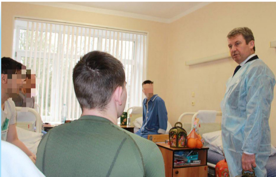
Встреча с военнослужащими, проходящими лечение в госпитале после ранения