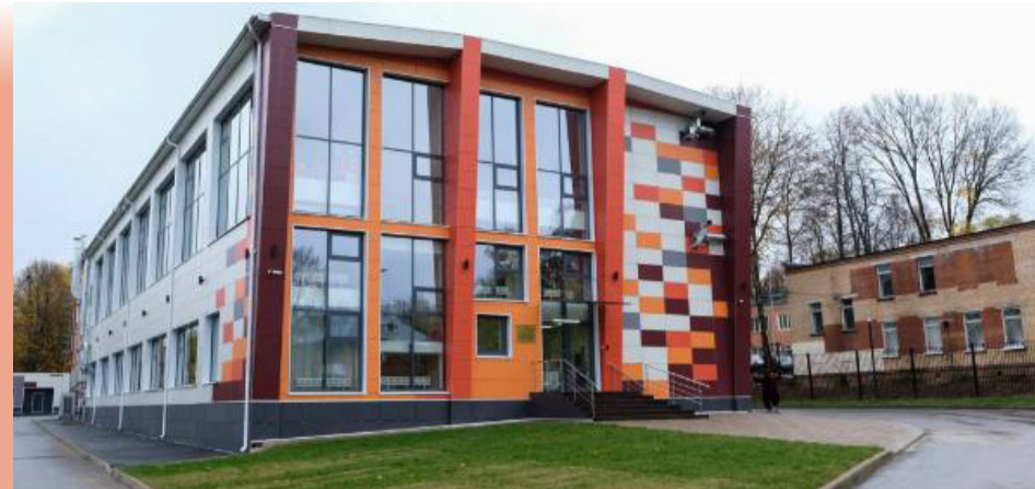
Спортивный комплекс «Трудовые резервы»

В рамках исполнения наказов, одобренных в «Народную программу» «Единой России», капитальный ремонт был проведен в Апрелевской школе №4 и Петровской школе им. Героя РФ Д.В. Межуева. В обоих учреждениях была проведена внутренняя отделка всех помещений, утеплены