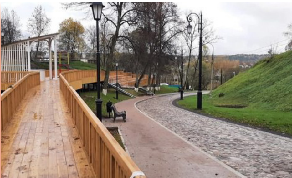
Верея. Благоустройство центра города

обустройству пешеходных коммуникаций, установке новых опор освещения, планируется обустроить прогулочную зону со смотровой площадкой, будут установлены лавочки и урны, а также видеонаблюдение, подключенное к системе «Безопасный регион». Дополнительно будут выполнены работы по озеленению территории городища более чем на 6000 кв. м. Общая площадь работ охватывает более 2,5 га.