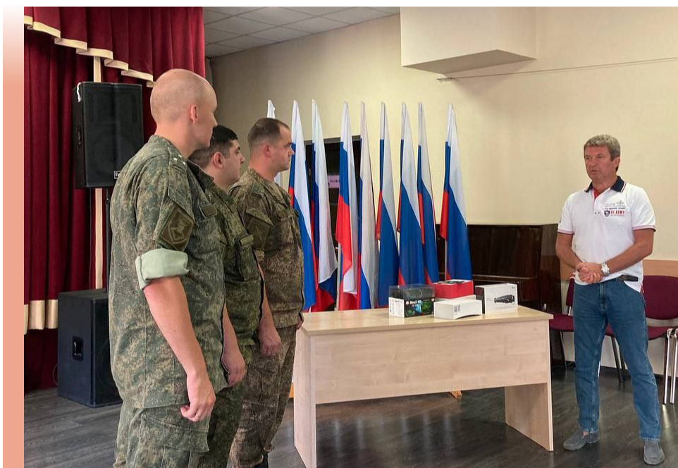
Передача тепловизоров военнослужащим Таманской дивизии

Параллельно с оказанием адресной помощи мы законодательно закрепили перечень мер поддержки участников СВО и их семей.