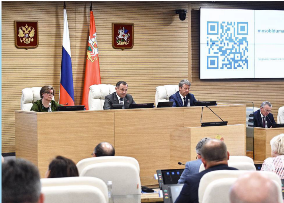
Заседание Московской областной Думы