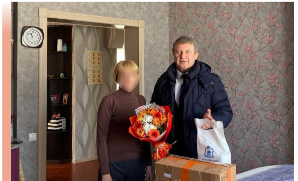
Встреча с семьей мобилизованного для передачи раций и комплектов для ремонта техники