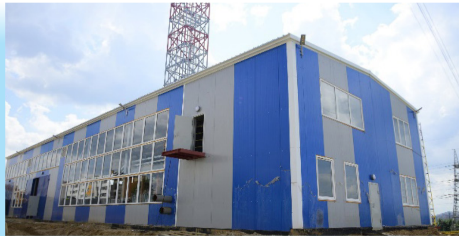
Котельная на ул. Маршала Куркоткина

Так, в этом году текущий ремонт начался в Верейской больнице, в рамках которого были отремонтированы цоколь, фасад, лестницы, перекрытия здания и кабинеты врачей. Дополнительно выделена субсидия и на приобретение новой мебели.