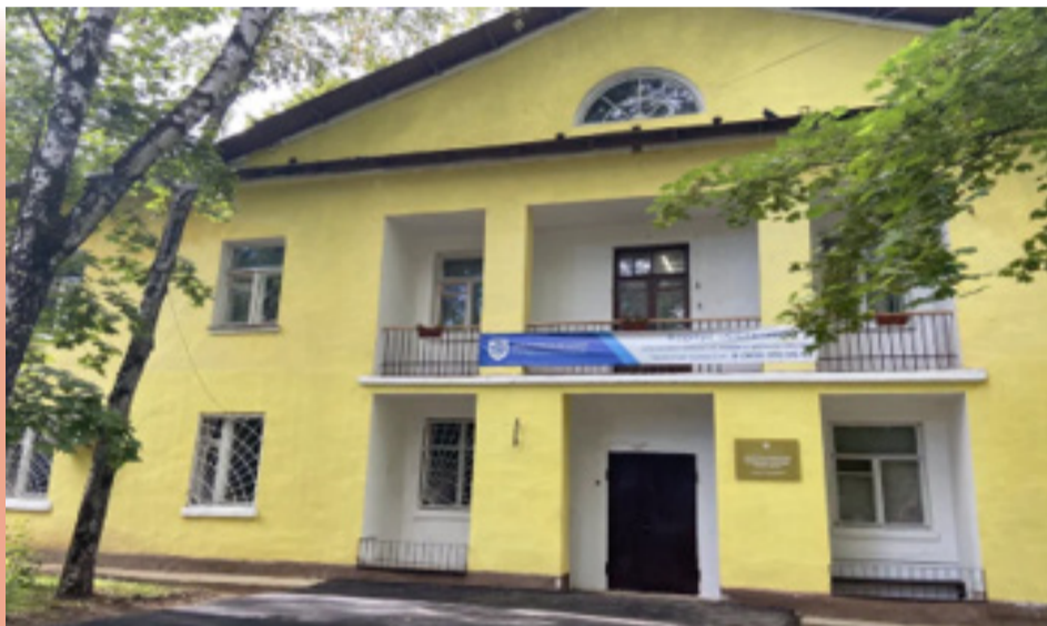
Корпус «Селятино» Краснознаменского городского колледжа