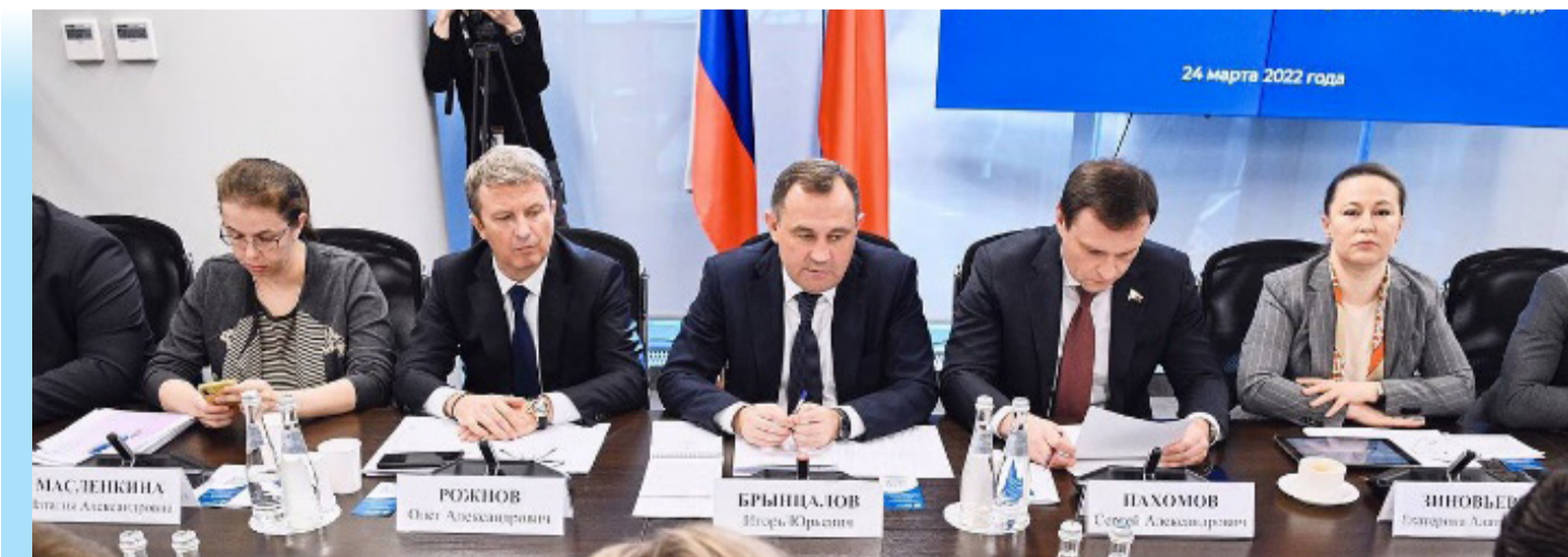
Совещание МособлДумы о мерах по повышению устойчивости экономики в условиях санкций

В 2022 году мы провели два заседания: одно – в апреле в Усадьбе Гребнево, расположенной в городском округе Щелково, второе – в сентябре в Усадьбе Горенки, расположенной в городском округе Балашиха.