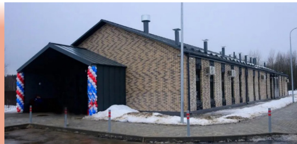
Офис врача общей практики в Новой Ольховке

В 2022 году в Новой Ольховке был построен офис врача общей практики, площадь здания составляет 386 кв. м. В офисе оборудованы кабинет медицинской профилактики, процедурный и перевязочная, прививочный кабинет, экспресс-лаборатория, кабинеты гинеколога, стоматолога, физиотерапии, отделение дневного стационара и детский прививочный кабинет.