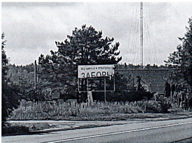
Фото объекта наружной рекламы