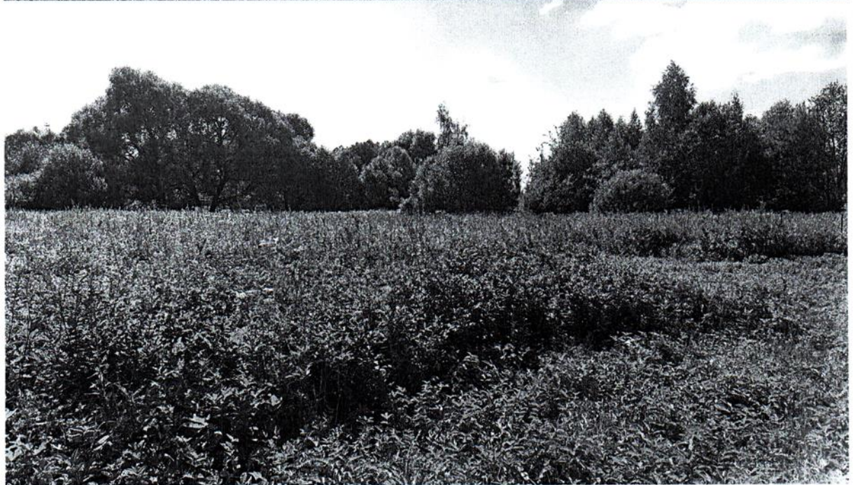
Доступ на испрашиваемую территорию