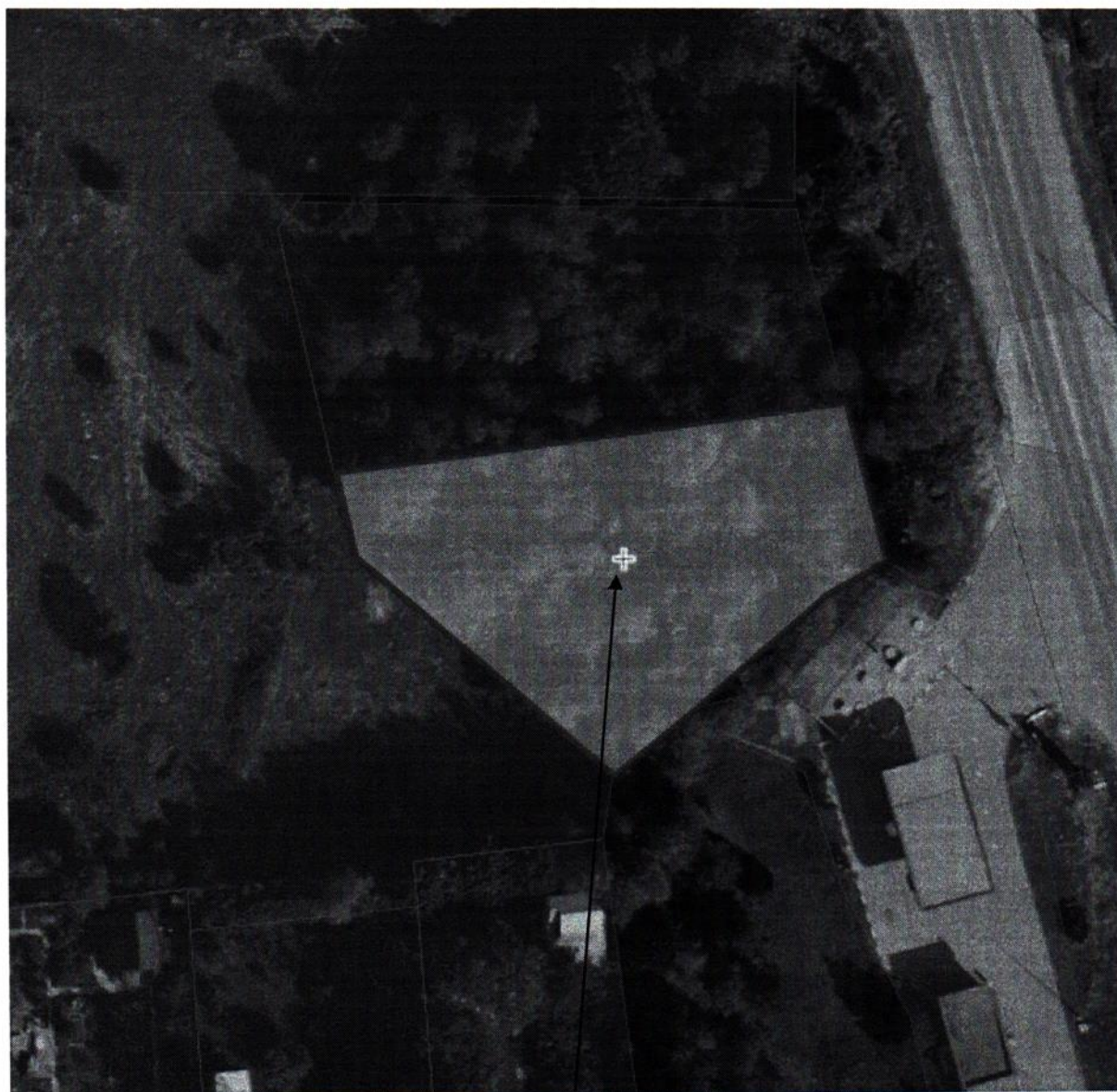
Обследуемый участок с КН 50:26:0130303:509