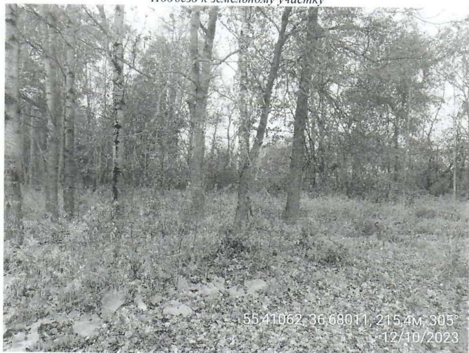
Подъезд к земельному участку

55.41062, 36.68011, 215,4м, 305° 12/10/2023