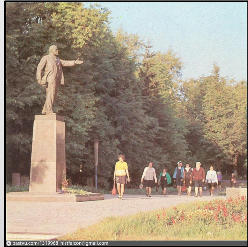
Памятник Ленину на площади Свободы в Наро-Фоминске. 70-80-е годы.