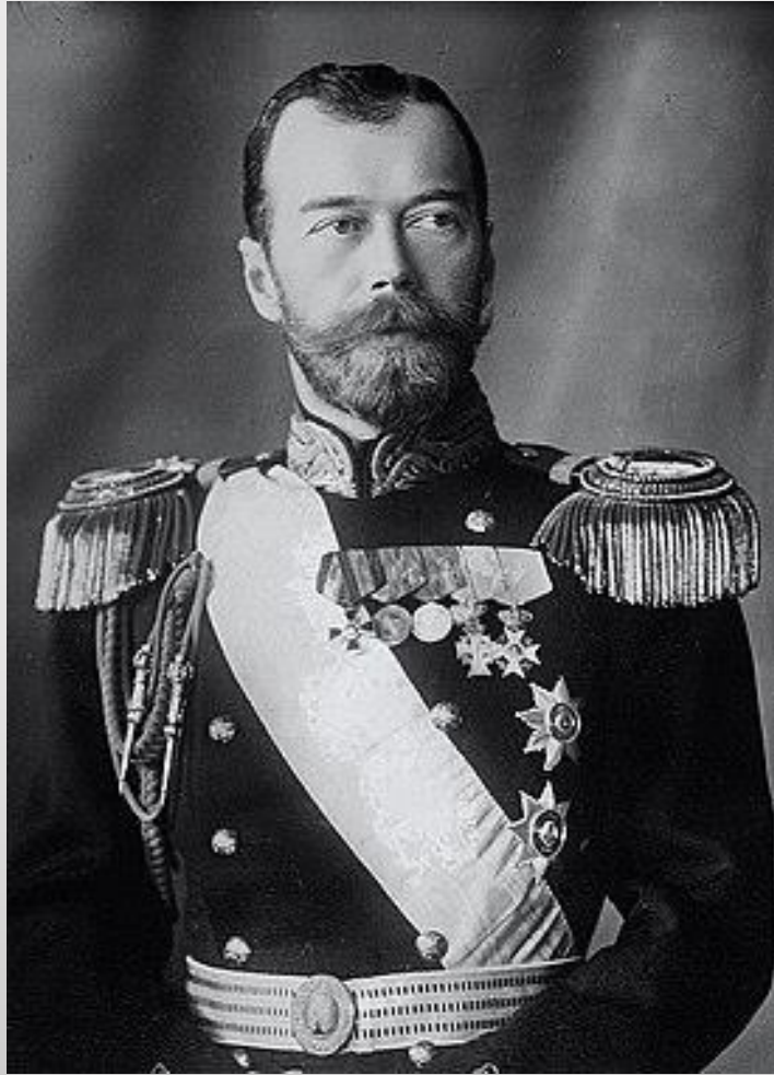
Царь Николай II