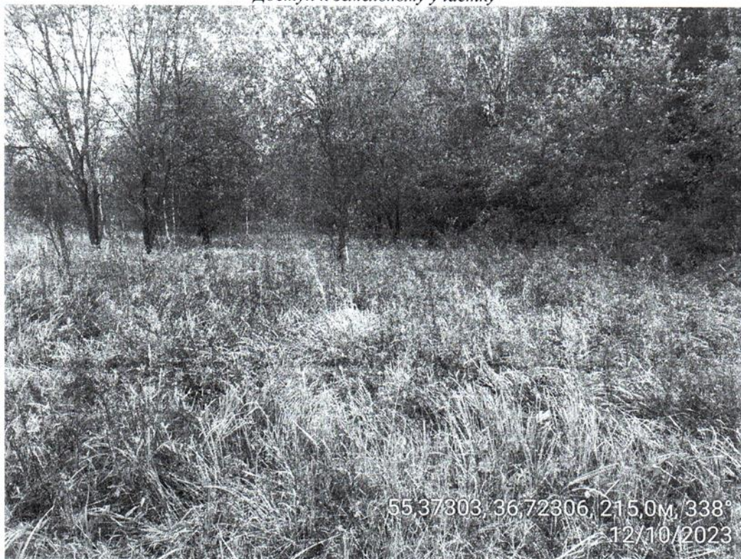
Доступ к земельному участку

55,37303, 36,72306, 215,0м, 338° 12/10/2023