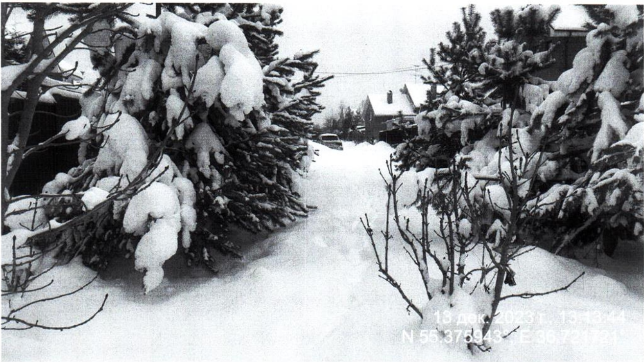
Доступ к участку