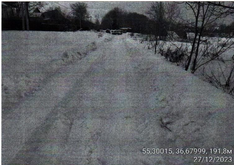
Доступ к земельному участку

Московская область, Наро-Фоминский городской округ, д.Башино Земельный участок с КН 50:26:0120508:468 (адрес земельного участка)