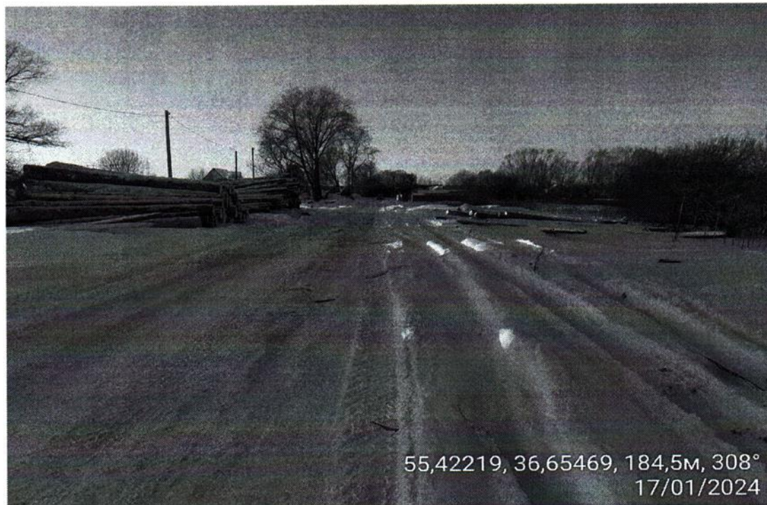
Доступ к земельному участку