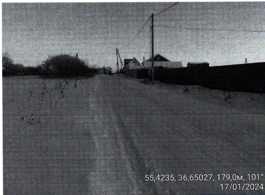
Доступ к земельному участку