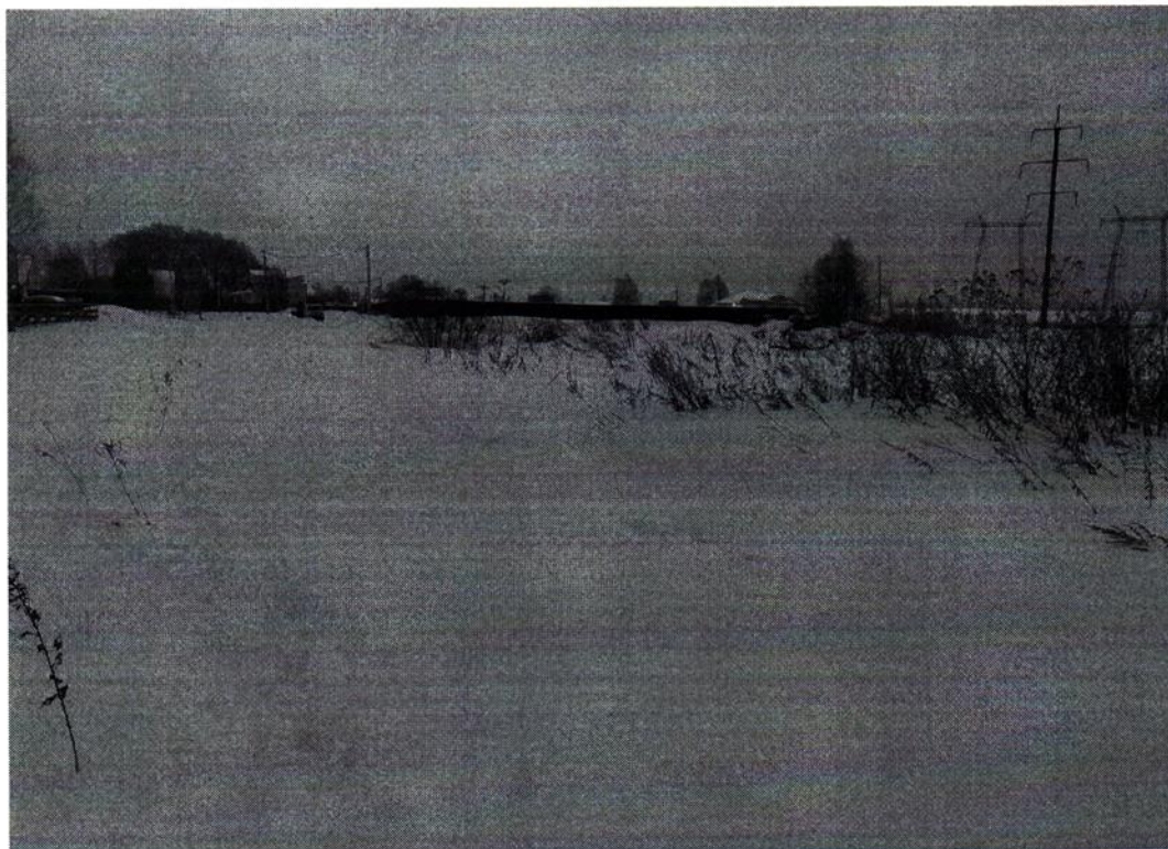
Доступ к земельному участку

Российская Федерация, Московская область, Наро-Фоминский городской округ, д. Таширово, Земельный участок с КН 50:26:0080803:401 (адрес земельного участка)