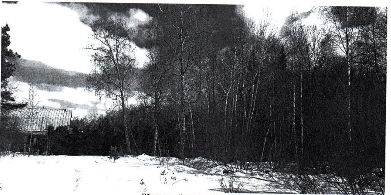
Обследуемый земельный участок