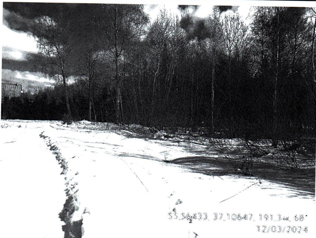
Обследуемый земельный участок

Московская область, Наро-Фоминск, г. Апрелевка