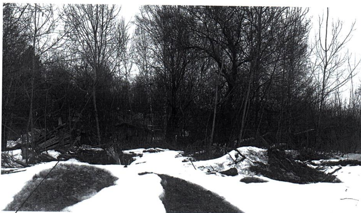
Элементы деревянных строений, отображенные на фото, расположены в границах ЗУ с КН 50:26:0160109:1295