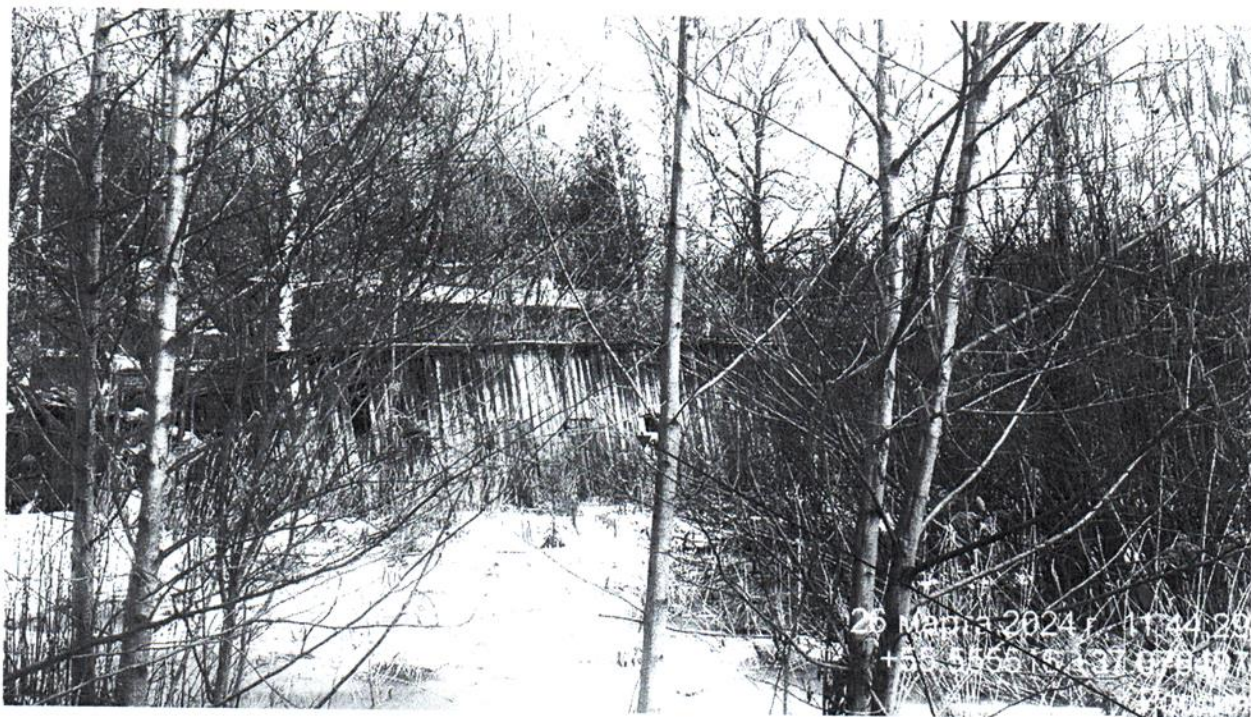
Деревянный сарай, отображенный на фото, расположен в границах земельного участка с КН 50:26:0160109:1295