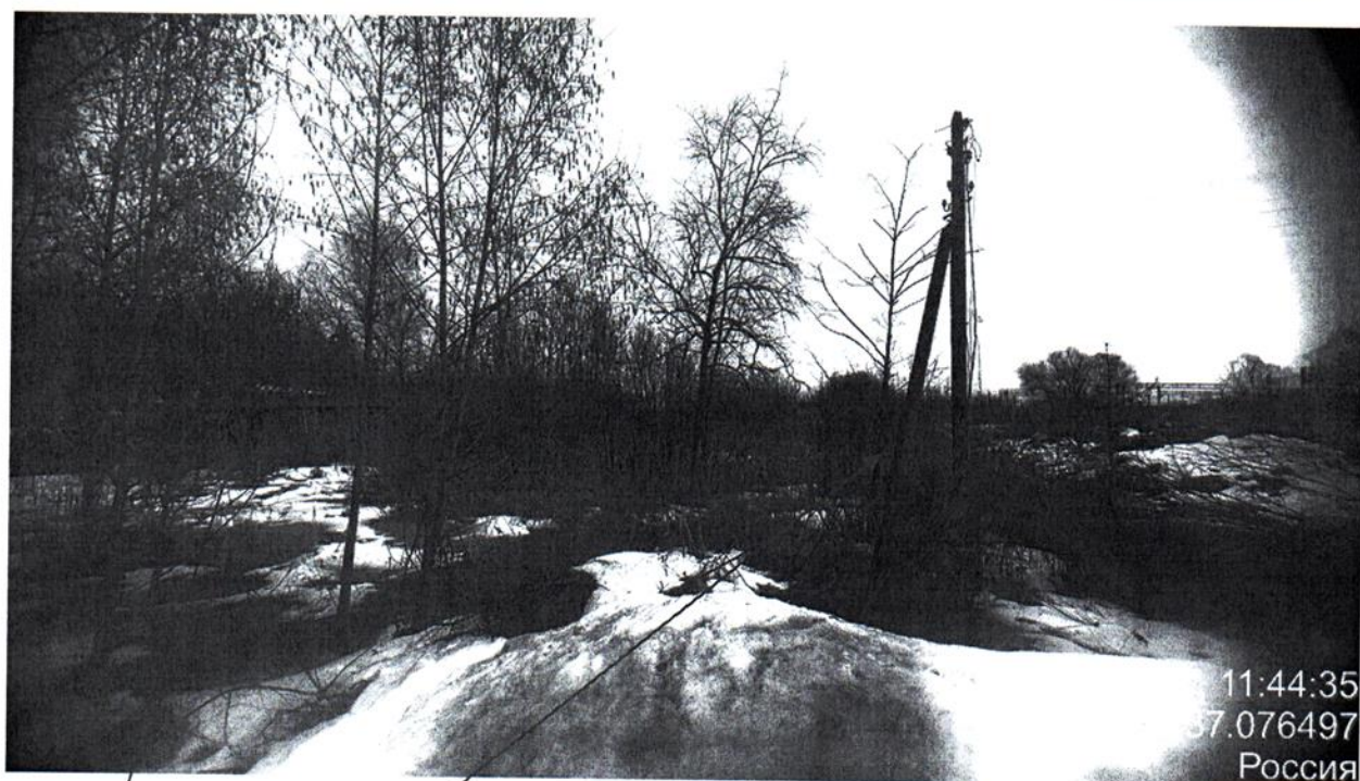
Деревянный сарай и опора ЛЭП, отображенные на фото, расположены в границах земельного участка с КН 50:26:0160109:1295