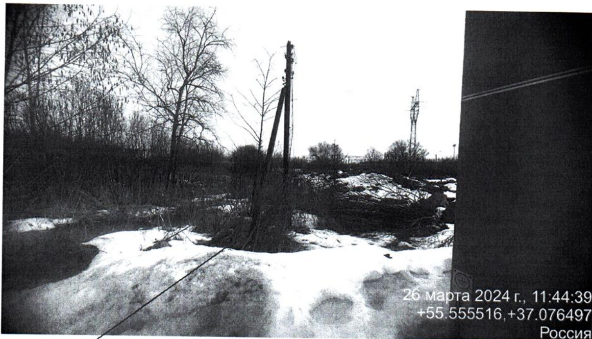
опора ЛЭП, отображенная на фото, расположена в границах земельного участка с КН 50:26:0160109:1295