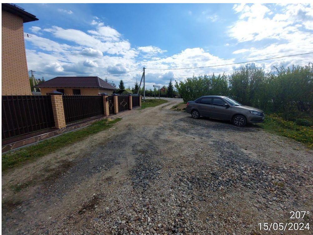
Доступ к земельному участку

Московская область, г.о.Наро-Фоминск, с.Каменское, Земельный участок с КН 50:26:0130804:889 (адрес земельного участка)