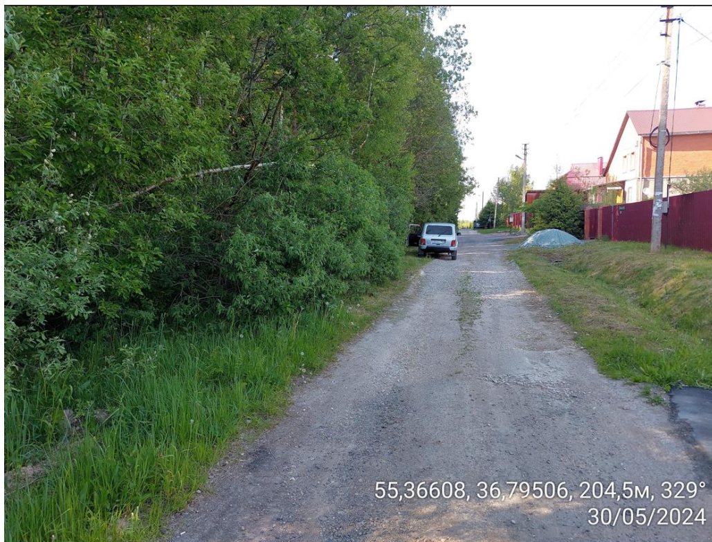
Доступ к земельному участку