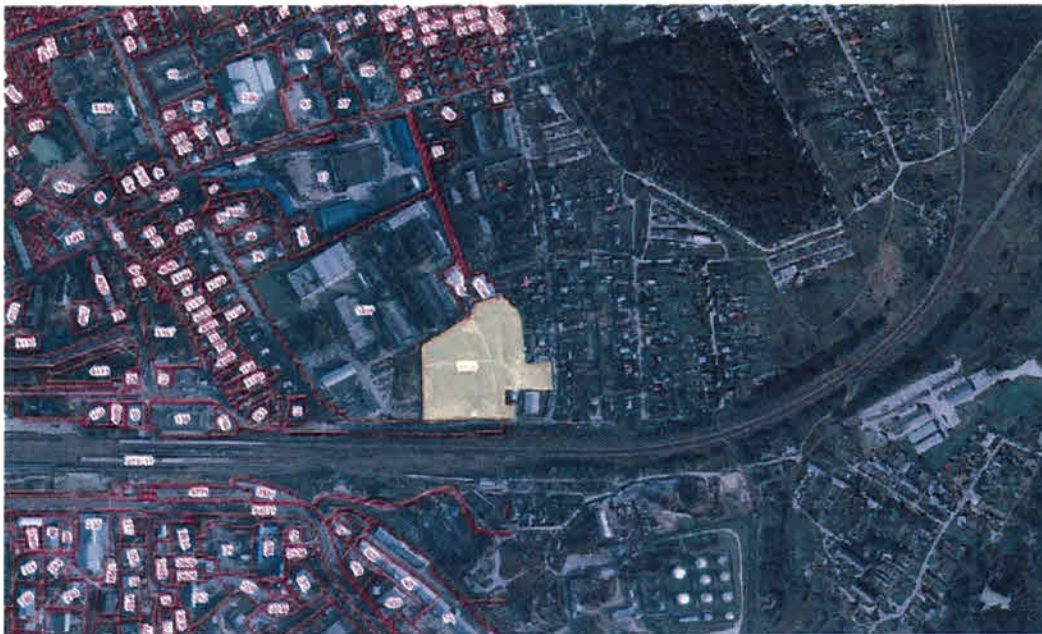
Рисунок 3 – Космоснимок рассматриваемой территории

Космоснимок рассматриваемой территории представлен на рисунке 3.