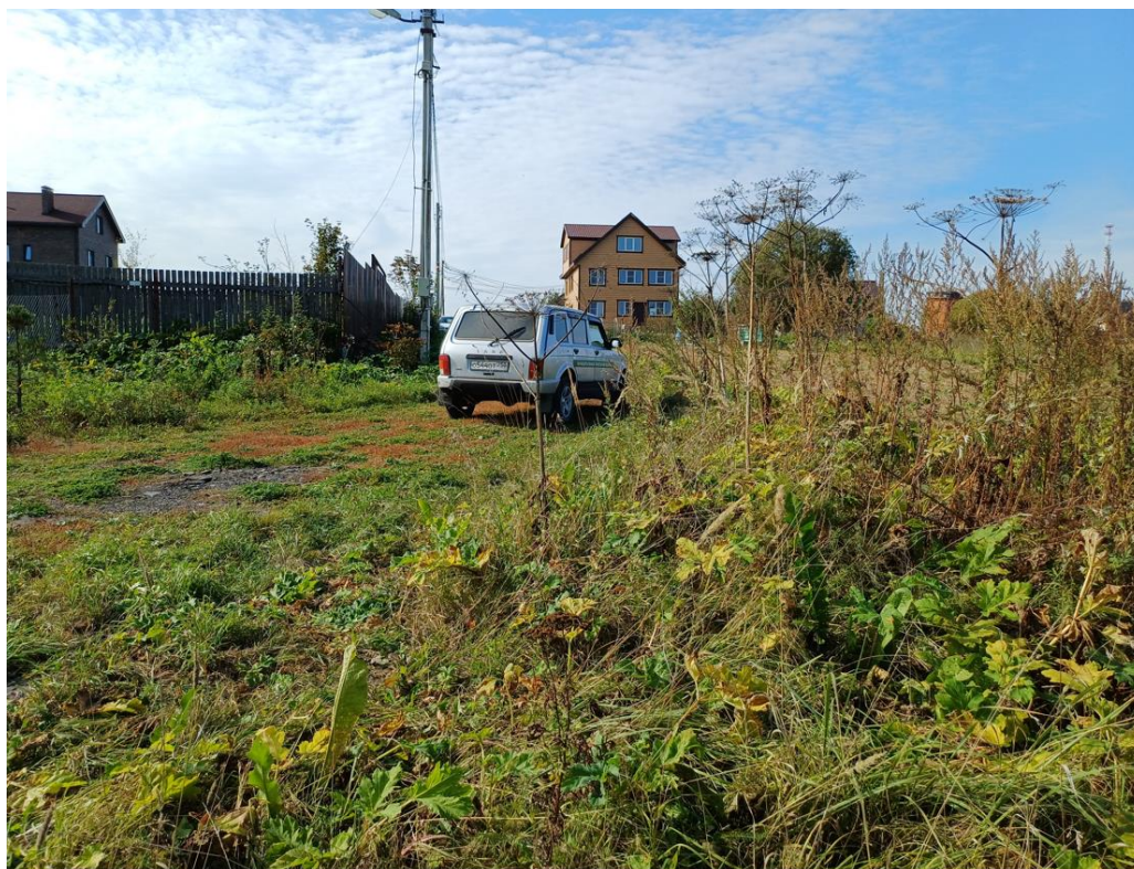
Доступ к земельному участку

Российская Федерация, Московская область, г.о. Наро-Фоминский, с. Каменское Земельный участок с КН 50:26:0130804:853 (адрес земельного участка)