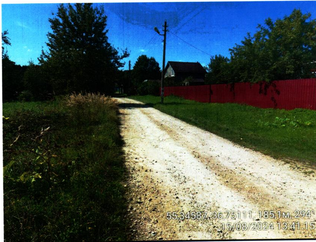
Доступ к земельному участку

Российская Федерация, Московская область, Наро-Фоминский городской округ, д. Горчухино Земельный участок с КН 50:26:0130301:395 (адрес земельного участка)