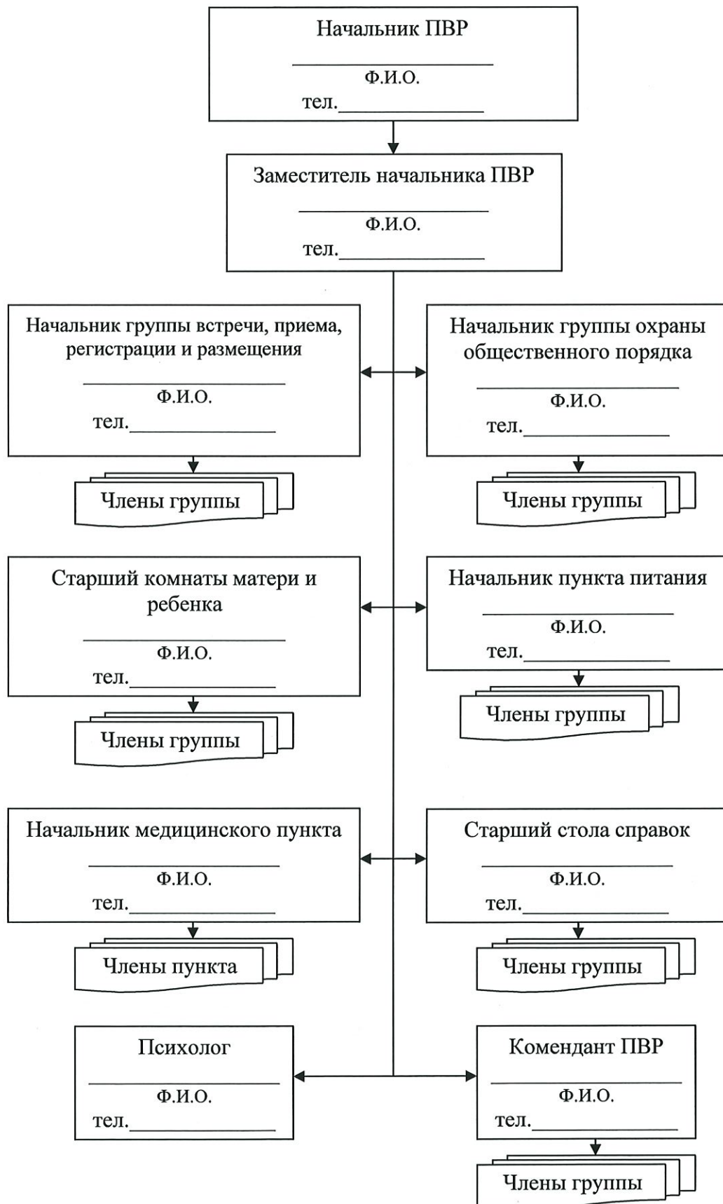
Схема оповещения и сбора администрации ПВР № _____